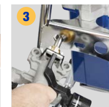
3 Lösen der Pumpe und Entnehmen der Patrone mittels Sechskant-Rahmenfitting