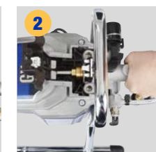
2 Pumpensektion entnehmen