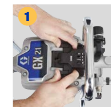
1 Zugangsabdeckung aufschieben und anheben