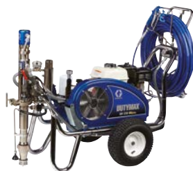
DUTYMAX™ GH230 HD PROCONTRACTOR