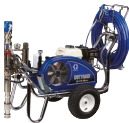
DUTYMAX™ EH230 HD PROCONTRACTOR