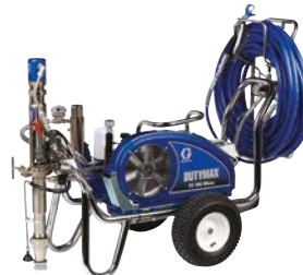
DUTYMAX™ EH300 HD PROCONTRACTOR