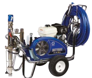
DUTYMAX™ GH300 HD PROCONTRACTOR